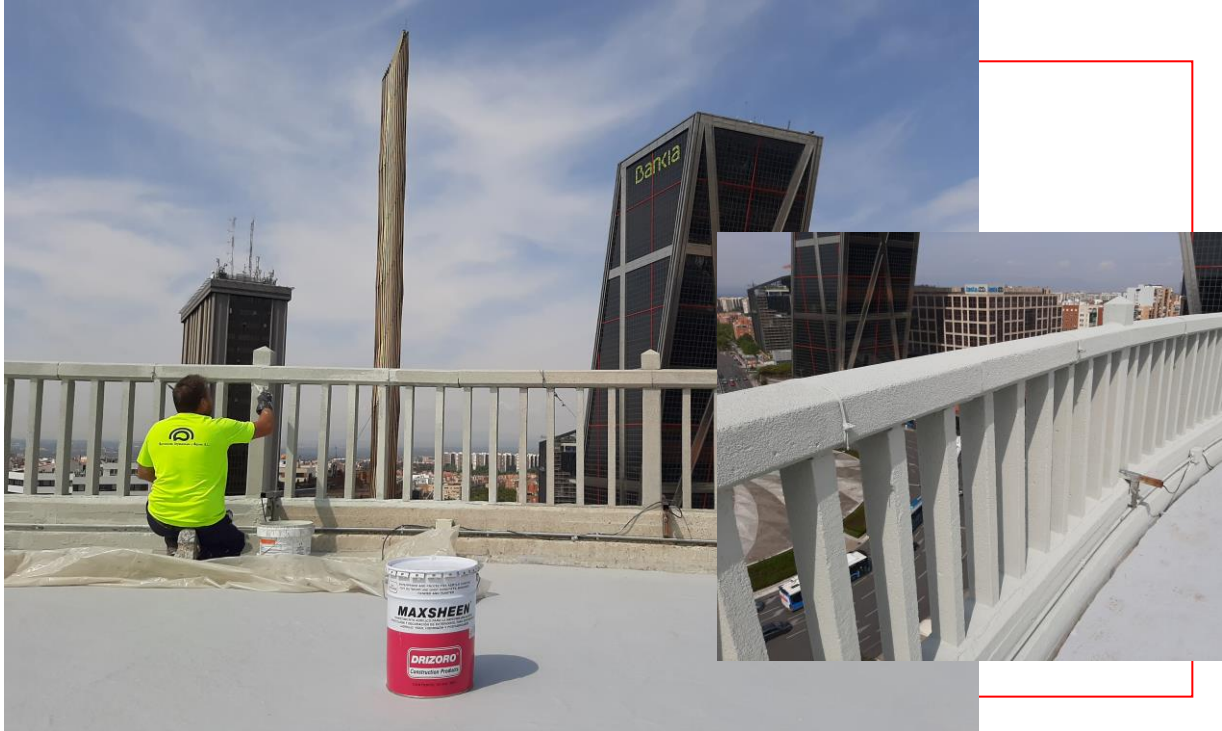
Revestimiento decorativo y protector MAXSHEEN ® sobre la superficie de la barandilla de hormigón de cubierta/ MAXSHEEN ® protective and decorative coating on concrete surface of the roof railing